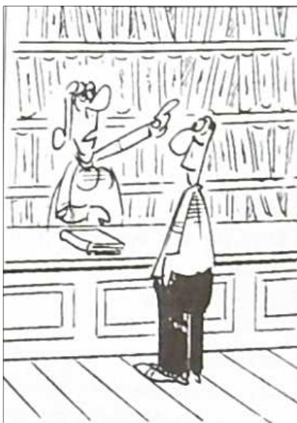
- La libro "Politikisto, ĉu honestulo?" Tien, dekstren, en la scienc-fikcia sekcio...