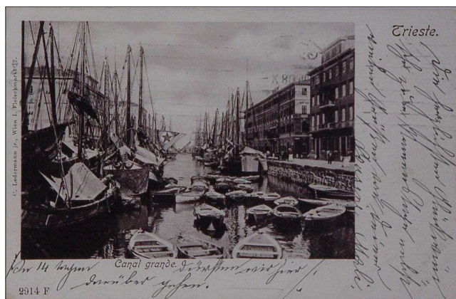
Tre interesa poŝtkarto (1906) speciale por la TEA-anoj: videblas velbarko kun esperanto-stela flago

Ni vidu tutunue la kialojn de la enterigo de tiu kanala parto. La precipa celo estis krei "triumfan vojon" kunligantan Placon Oberdan kaj Placon Hortis. Nova, vasta, larĝa strato laŭ kiu la centurianoj kaj rotoj de la faŝisma reĝimo estus marŝintaj parade antaŭ la konstruenda 'Sidejo de la faŝista partio', la nuntempa kvestorejo. Fronte al la kolonoj de la Sankta-Antona-preĝejo, anstataŭ marakvo kaj barkoj, ekaperis placo, kiu origine estis titolita laŭ la Savoja reĝo Umberto la 1 a . Neeviteble estis donitaj al la triestanoj la "oficialaj" motivoj pri tiu enterigo de la fina kanala parto: krom tiu "reĝima", la tiutempa komunuma estraro klar-