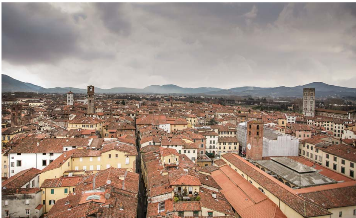
Panoramo de Lucca, la itala ĝemelurbo de Bonaero

Oni povas nombri okdek (efektive!) da preĝejoj en la malnova urbo, el kiuj kelkaj havas milon da jaroj. La preĝejo de Sankta Frediano estas la sanktejo de la mumio de Sanktulino Zita kiu estas videbla en vitra ĉerko. Vidu krome http://en.wikipedia.org/wiki/Lucca .