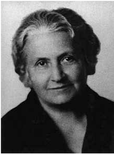
Maria Montessori (1870-1952)