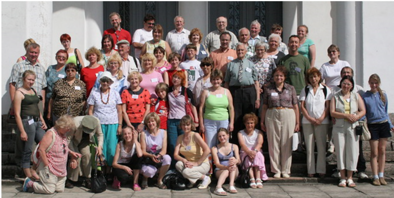
Grupfoto el BET 43