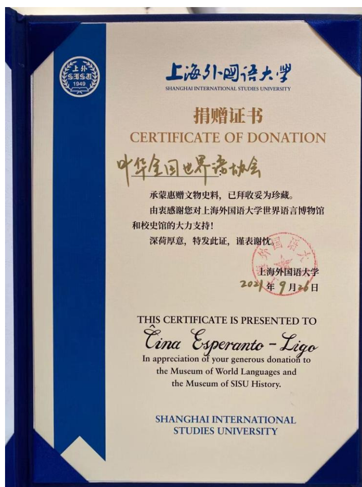
Atestilo pri libro-donaco

Por subteni disvolviĝon de la Muzeo pri Mondaj Lingvoj sub la Ŝanhaja Universitato de Internaciaj Studoj kaj aktive antaŭenigi Esperanton, la Ĉina Esperanto-Ligo donacis al la muzeo kvin librojn, 200 Antikvaj Ĉinaj Poemoj (ĉine kaj Esperante), Ĉina Antologio (1979-2009) (Esperante), Noktomezo (Esperante), Rano (Esperante), kaj Sieĝata Fortikaĵo (Esperante). La Ĉina Esperanto-Ligo ricevis atestilon pri libro-donaco de la Ŝanhaja Universitato de Internaciaj Studoj.